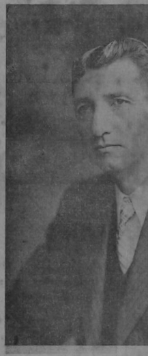
Lic. don LEON CORTES CASTRO